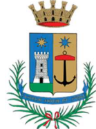
Comune di Santa Marinella